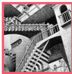
מקורות יודעי דבר