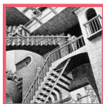
מקורות יודעי דבר

זהו לקט מצומצם מבין הנושאים שעסק בהם. מלבד היותו צוהר לעולם שהיה ואיננו - הוא מסוגל לסייע במאבק המתמשך בשינה ובשגרה הנוחה והמתעתעת, להעיר ולעורר, להרהר ולערער. כל זאת מתוך בקשת אלוהים, עמידה בתפילה, דרישת התורה והעפלה אל העולמות העליונים.